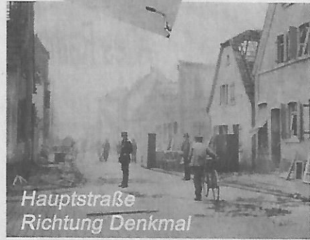
Hauptstraße Richtung Denkmal