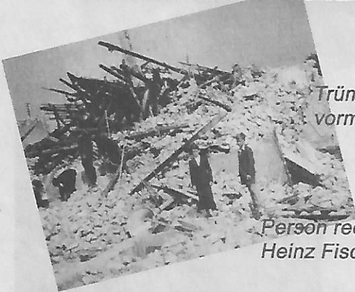
Trümmerhaufen vorm Rathaus