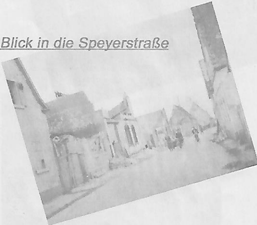
Blick in die Speyerstraße