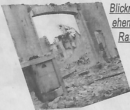
Blickrichtung ehemaliges Rathaus