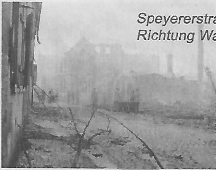
Speyererstraße Richtung Waldsee