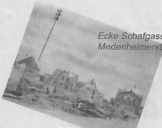
Ecke Schafgasse Medenheimerstraße