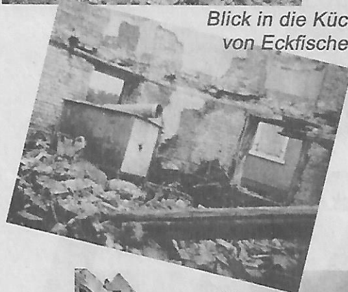
Blick in die Küche von Eckfischer