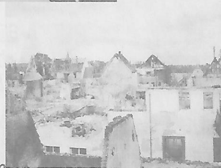
um das ehemalige Rathaus