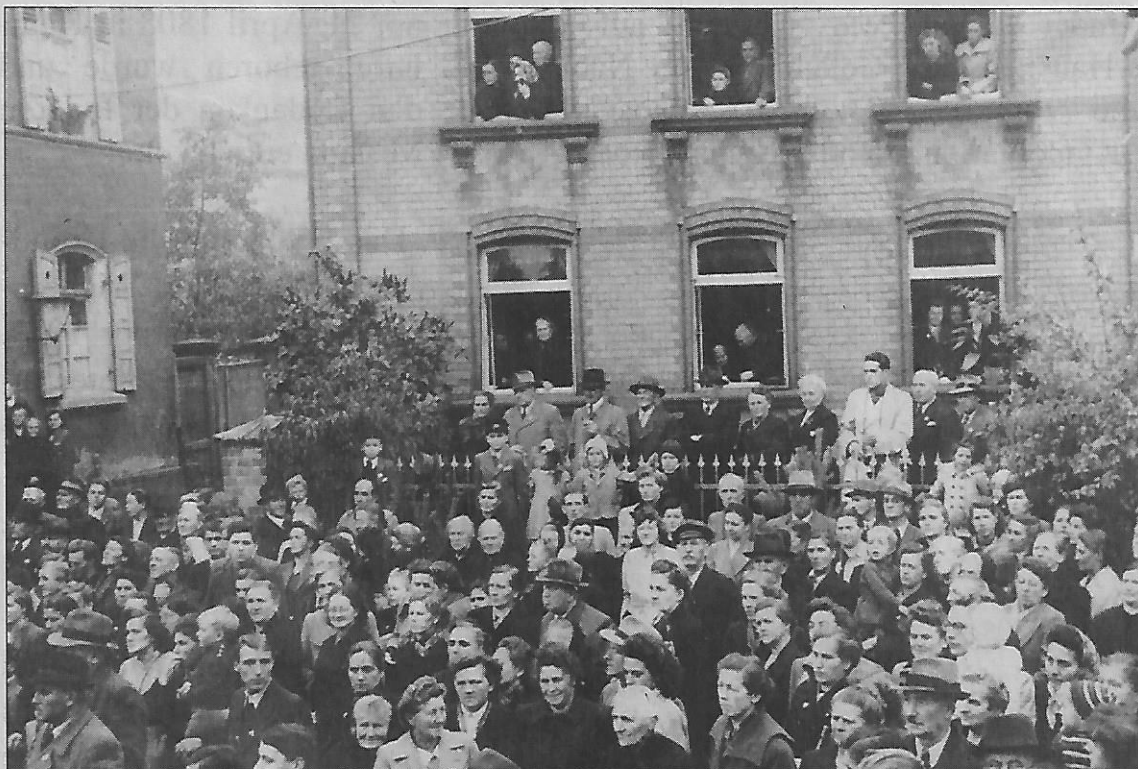
Die Bevölkerung beobachtet interessiert die Grundsteinlegung von der gegenüberliegenden Straßenseite aus (Pfarrhaus, Wohnhaus Becht)