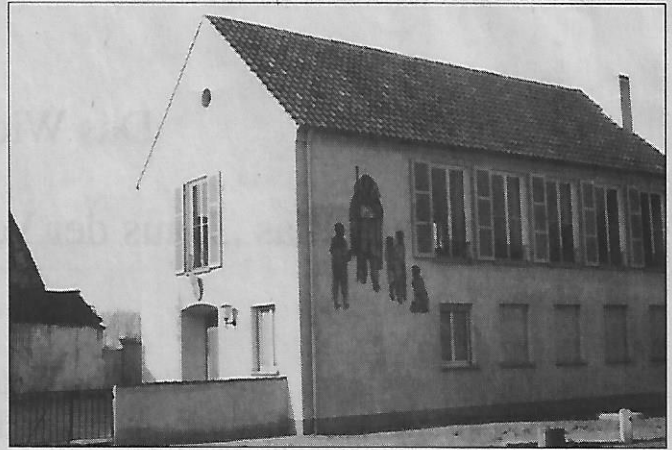
Text: Theodor Frosch Redaktion: Iris Rechner