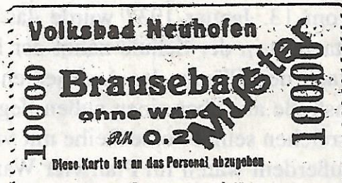
Einlasskarte zur Benutzung des Brausebades

Erst als immer mehr Häuser und Wohnungen mit eigenen Badezimmern ausgestattet wurden, weil der einstige Luxus erschwinglich geworden war, musste das Volksbad wegen mangelnder Besucherzahlen endgültig die Tore schließen.